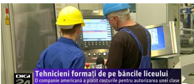
Tehnicienii formați de pe băncile liceului O companie americană a plătit costurile pentru autorizarea unei clase