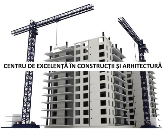
CENTRU DE EXCELENȚĂ ÎN CONSTRUCȚII ȘI ARHITECTURĂ